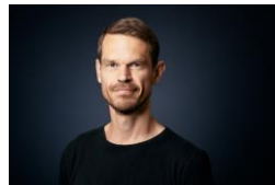
Professor og forfatter, Svend Brinkmann