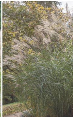
Miscanthus sinensis 'Siberfeder'