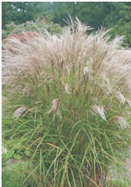
Miscanthus kleine silberspinne