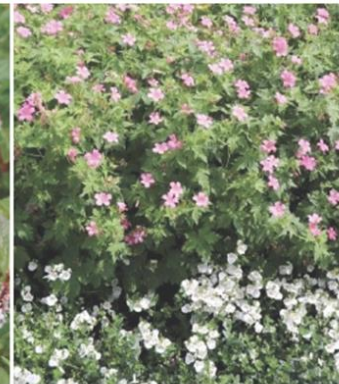
Miscanthus kleine silberspinne